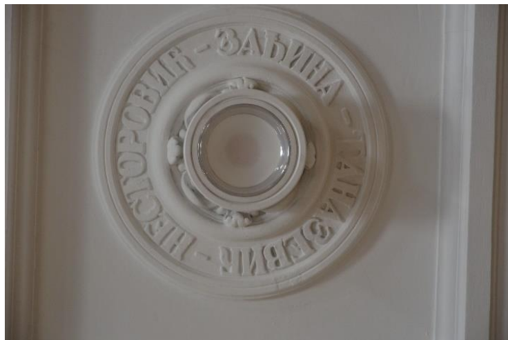
Розета у холу Техничког факултета, у централном делу таванице, са потписима пројектаната зграде и професорима Техничког факултета: Зајина, Несторовић, Таназевић