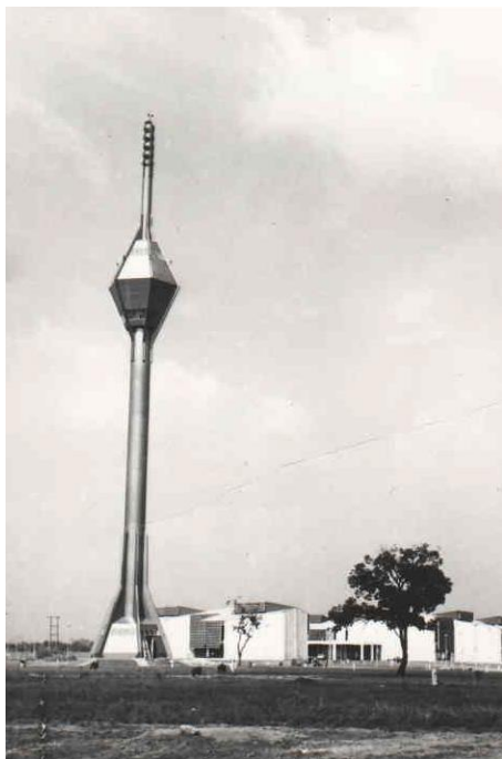
Лагос, Нигерија