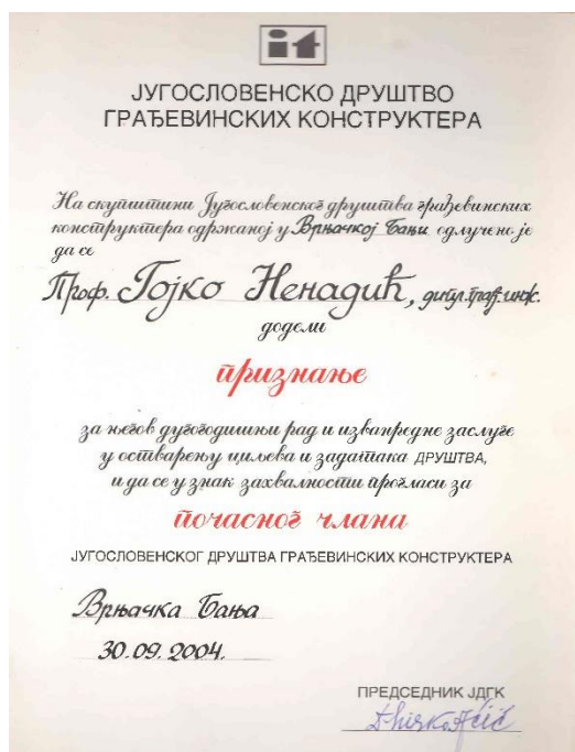
Признање за почасног члана југословенског друштва грађевинских конструктора, 2004. година