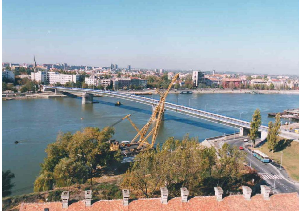
Мост „Варадинска дуга“