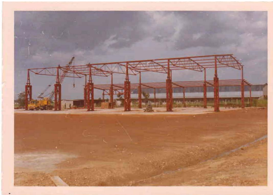
Фабрика челичних конструкција, Лусака, Замбија