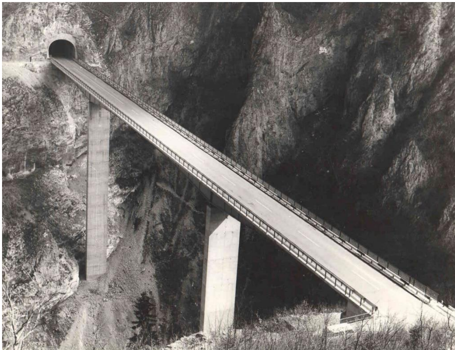
Мост преко реке Ибар на код Рожаја на Јадранској магистрали