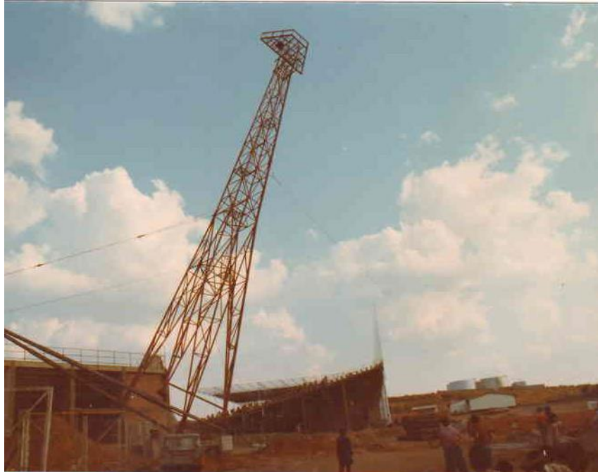
Лусака, Замбија стубови за осветљење стадиона, 1970.