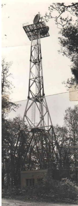
Антенски стуб на Фрушкој гори висина 48 м