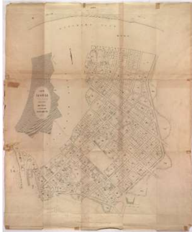
Литографисани план Емилијана Јосимовића објављен у његовој књизи „Објаснење предлога оног дела вароши Београда што лежи у шанцу са једним литографисаним планом у Р 1/3000’, 1867. године. (Универзитетска библиотека „Светозар Марковић“)